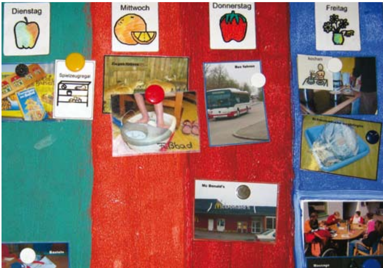
Wochenplan in Bildern