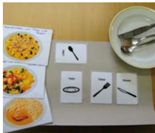
Bilderkarten zur Auswahl von Speisen

Mit Hilfe der Symbolkarten haben die Menschen die Möglichkeit eine eigene verständliche Sprache zu trainieren.